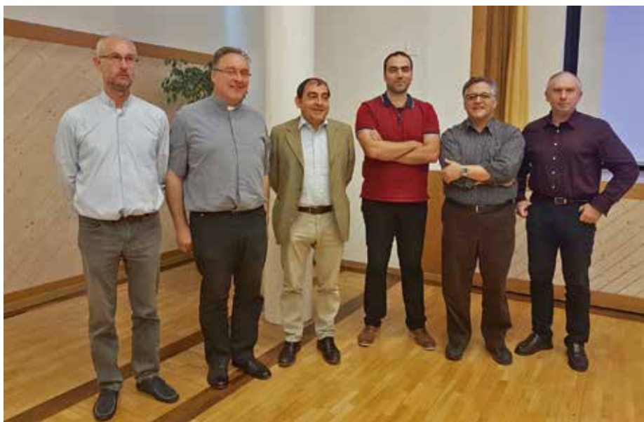
Il pastore con i missionari italiani della regione pastorale diocesana di San Viktor

L'auspicio è che questo incontro possa avere un seguito e possa essere l'inizio di un cammino riconciliato e fraterno.